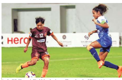
As the Fifa Women's World Cup begins on Thursday, the difference in the treatment of Indian men and women's football remains as wide as their rankings

ball in India is treated quite differently from morks. IWL winners Gokulam Kerala, for instance, were handed out a heque of 10 lakh. Compare that to what the winners of the men's Indian Super League (ISL) get: A whopping 86 crore. The IWL winners, in fact, were awarded less than half of what the fourth placed team in the men's Heague got (825 lakh). The cheque was handed over at a ceremony in Ahmedabad, Gujarat, where, after clicking a few pictures, the players were guided off the makeshift stage, the branding signages were turned around and the IWL logos were blocked. What was to be the prize distribution ceremony for the IWL ended up becoming an awards function for up becoming an awards function for the Gujarat State Football Association Club Championship, a men's event. As the Fifa Women's World Cup, a footballing extravaganza played every